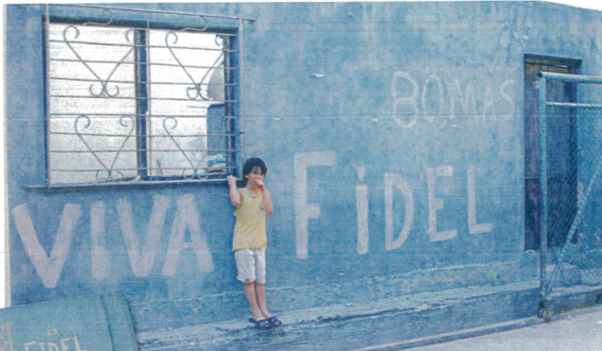
NIXES FLAT Buffle VarnosBien Fidel bleu Caraïbe